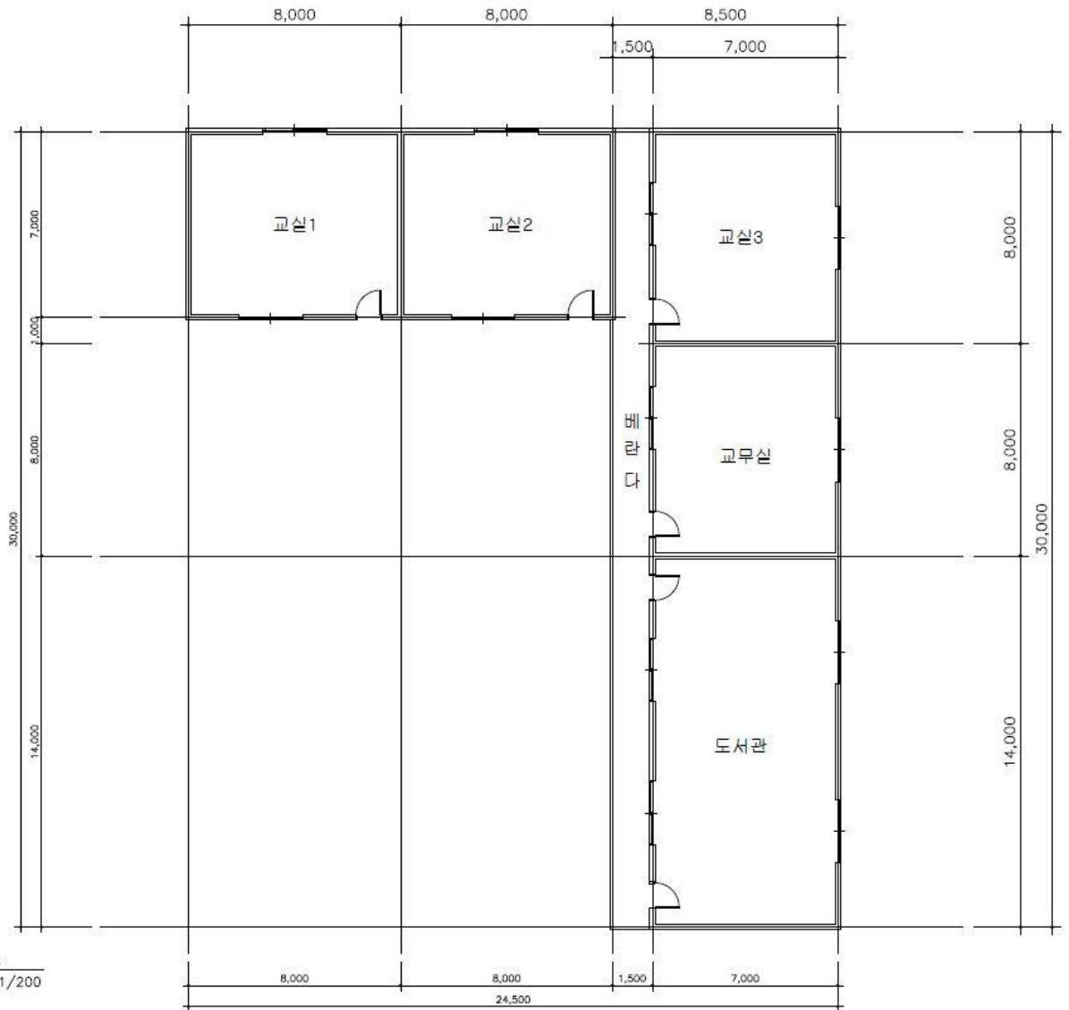
1 이면도 SCALE:1/200